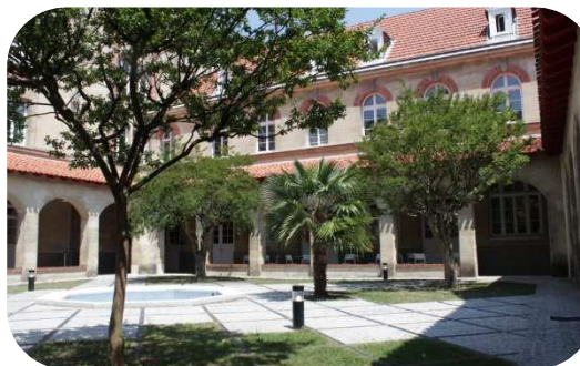
Espace Beaulieu Maison Saint Louis Beaulieu 145, rue de Saint Genès 33000 BORDEAUX